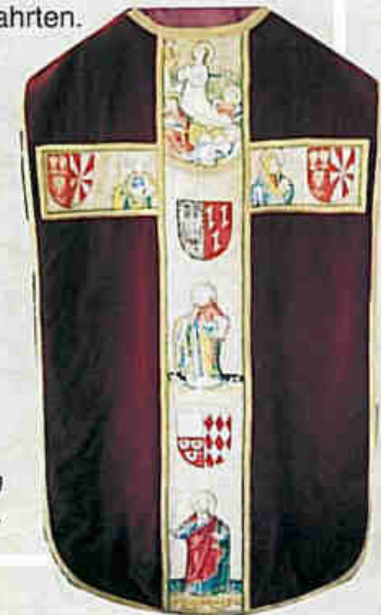
Messgewand aus Fleringen 1421.

Eine Bilderreihe berichtet über die Prümer Wallfahrten.