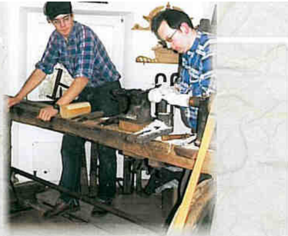
Drechsler aus Bleialf am „Tag der offenen Tür“ im Museum.