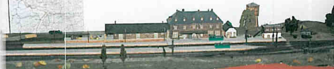
Modell des Prümer Bahnhofs 1916.

Auch die Apotheke kann an dieser Stelle genannt werden.